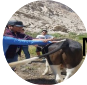
Modulo de inseminación artificial.