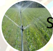
Sistemas de riego por goteo y aspersión.