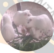
Galpón de cuyes y conejos