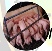
Módulo de Porcinos