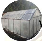
Viveros y terrenos de cultivo.