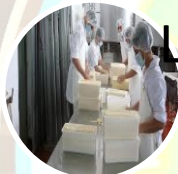
Laboratorio de lacteos, física y química.